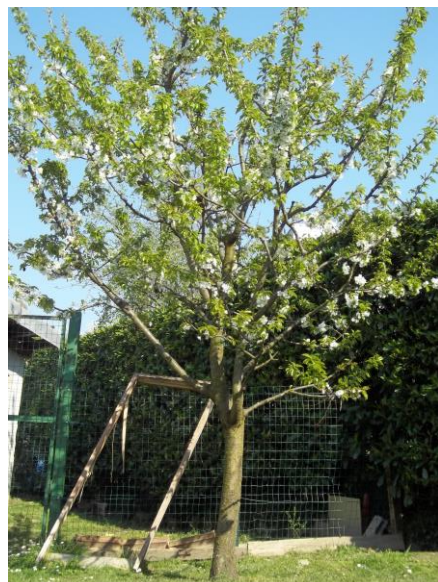
IL MIO CILIEGIO