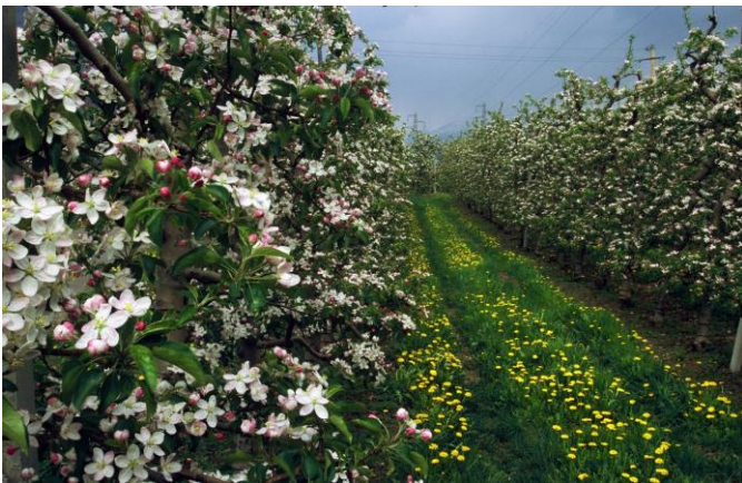
Meli della Valtellina