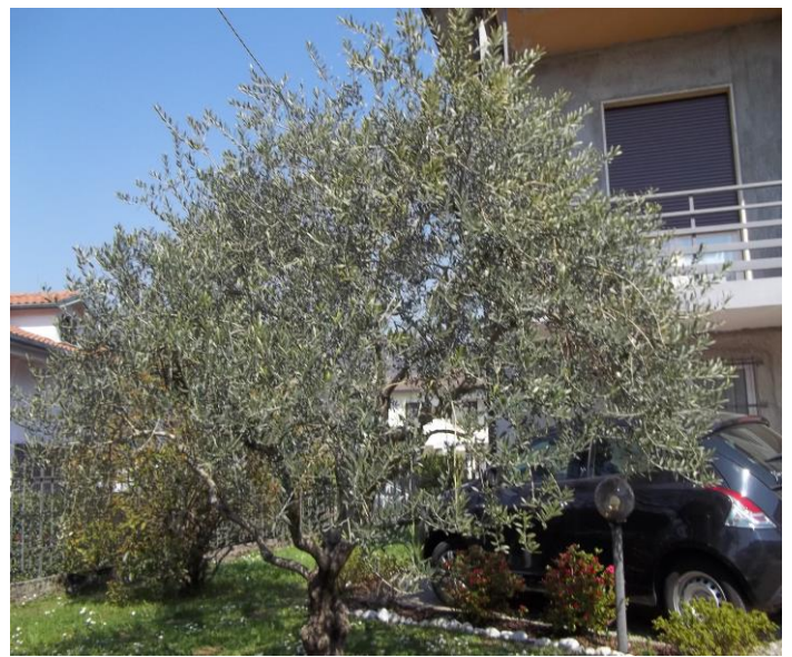
IL MIO ULIVO