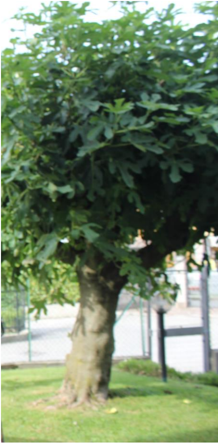
IL MIO FICO

IO A CASA MIA HO: 2 ULIVI, 1 CILIEGIO E 1 FICO.